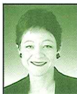
Baronessa Sarah Ludford (Reino Unido). Europarlamentaria, Grupo del Partido Europeo de los Liberales, Demócratas y Reformistas.