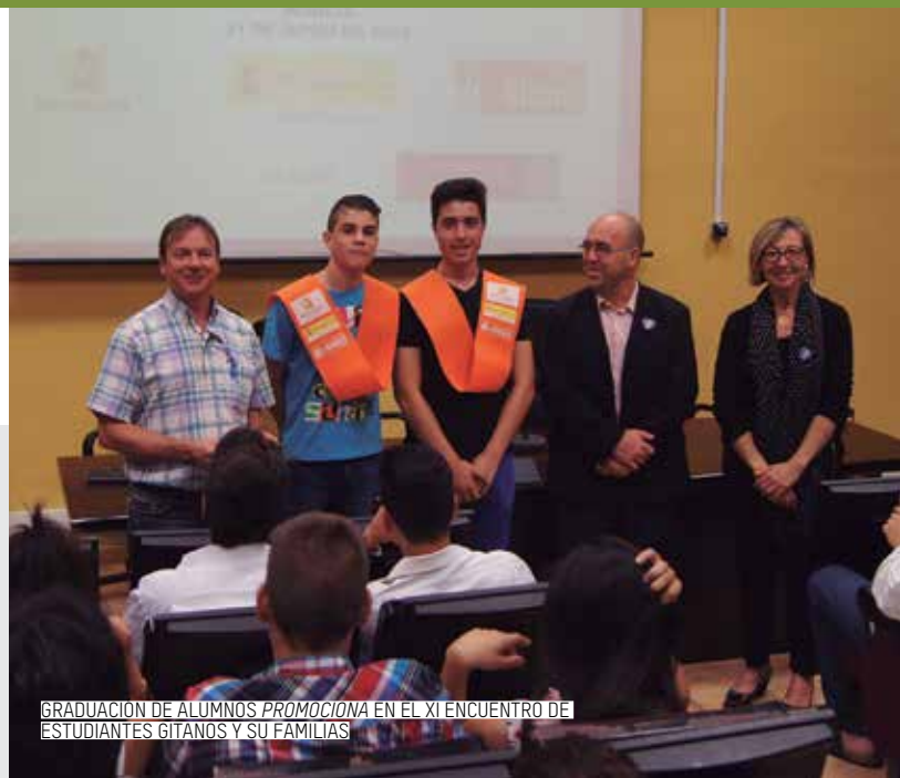
GRADUACIÓN DE ALUMNOS PROMOCIONA EN EL XI ENCUENTRO DE ESTUDIANTES GITANOS Y SU FAMILIAS