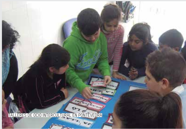
TALLERES DE OCIO INTERCULTURAL EN PONTEVEDRA

SEGUIMIENTO ESCOLAR. En centros educativos con alumnado gitano para reducir y prevenir el absentismo a través de actuaciones de mediación entre familia y escuela, en Pontevedra.