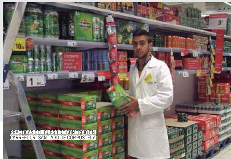
PRÁCTICAS DEL CURSO DE COMERCIO EN CARREFOUR, SANTIAGO DE COMPOSTELA

vo del programa ACAIS , que se afianza, al tiempo que se abren nuevas oportunidades de intervención en este ámbito.