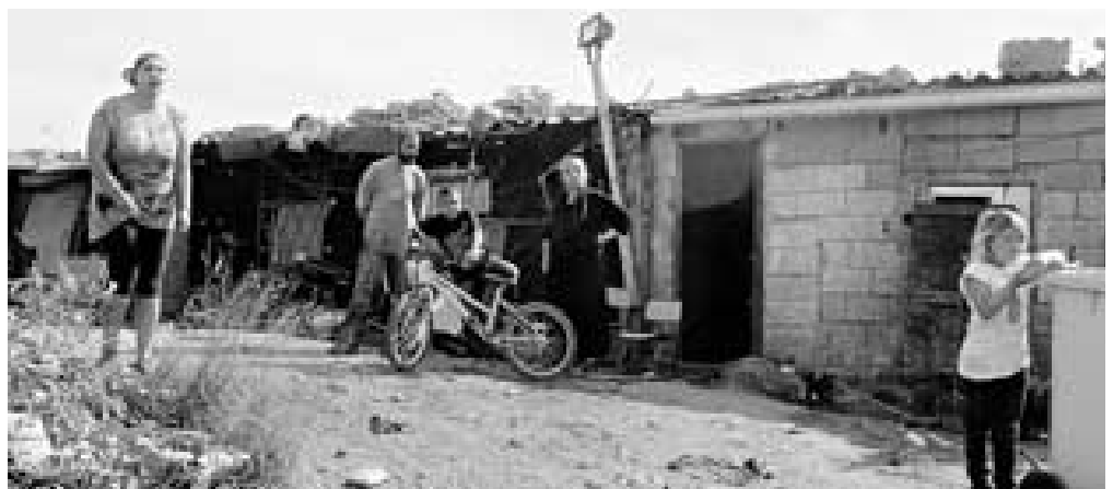
Algunas de las familias que no se adherieron en su día al plan municipal reclaman ahora ayuda de las instituciones

un programa para la integración de las familias de la Conservera Celta y que el trabajo se está realizando de la misma forma que en Penamoa: «En silencio y con tranquilidad, porque solo dará resultado si el trabajo se realiza así», afirmó.