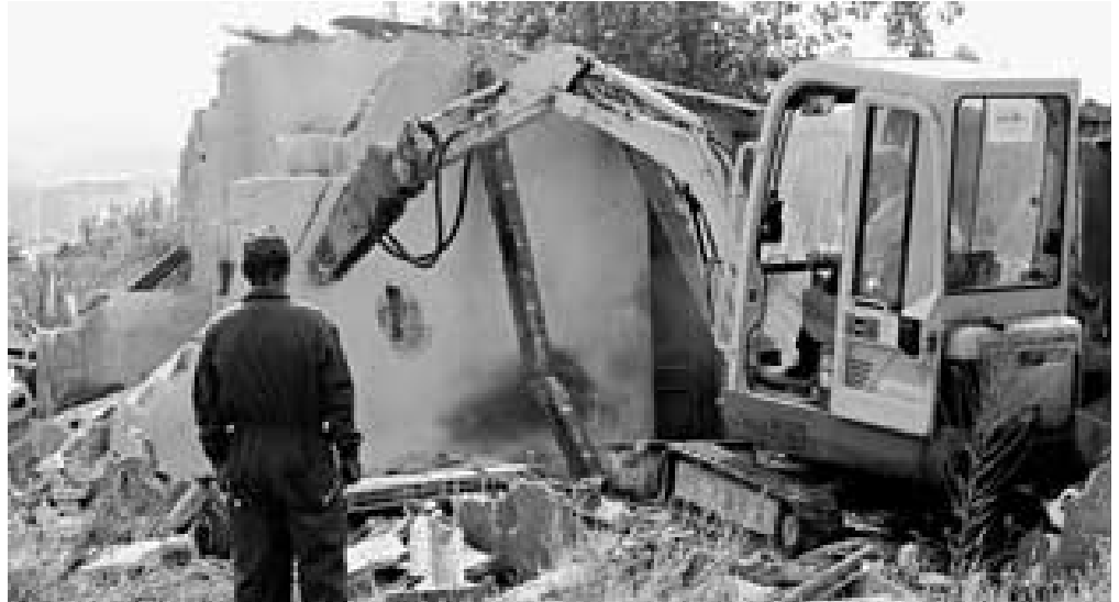
Las máquinas derribaron ayer por la mañana otra chabola, con lo que ya suman 131 las demolidas

La concejala de Servicios Sociales recordó que su departamento ya ha puesto en marcha