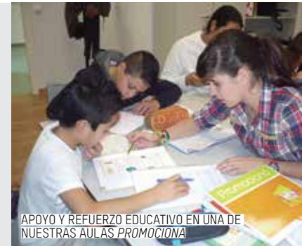
APOYO Y REFUERZO EDUCATIVO EN UNA DE NUESTRAS AULAS PROMOCIONA

PESE A LA CRISIS, EN 2013 NUESTRO PROGRAMA DE FORMACIÓN Y EMPLEO ACCEDER HA COSECHADO MEJORES RESULTADOS. HEMOS ATENDIDO A 200 PERSONAS MÁS QUE EN 2012 Y EL NÚMERO DE CONTRATOS DE TRABAJO HA CRECIDO UN 25%.