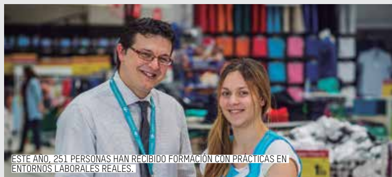
ESTE AÑO, 251 PERSONAS HAN RECIBIDO FORMACIÓN CON PRÁCTICAS EN ENTORNOS LABORALES REALES.