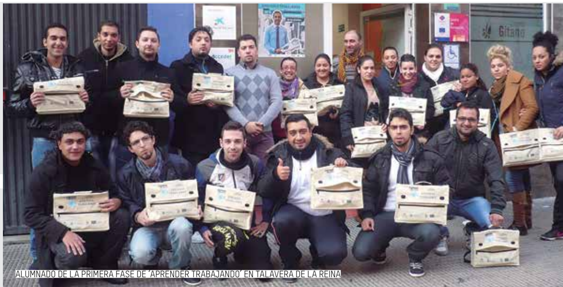
ALUMNADO DE LA PRIMERA FASE DE 'APRENDER TRABAJANDO' EN TALAVERA DE LA REINA