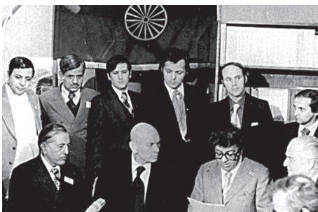
II CONGRESO INTERNACIONAL GITANO CELEBRADO EN GINEBRA SUIZA (1978)